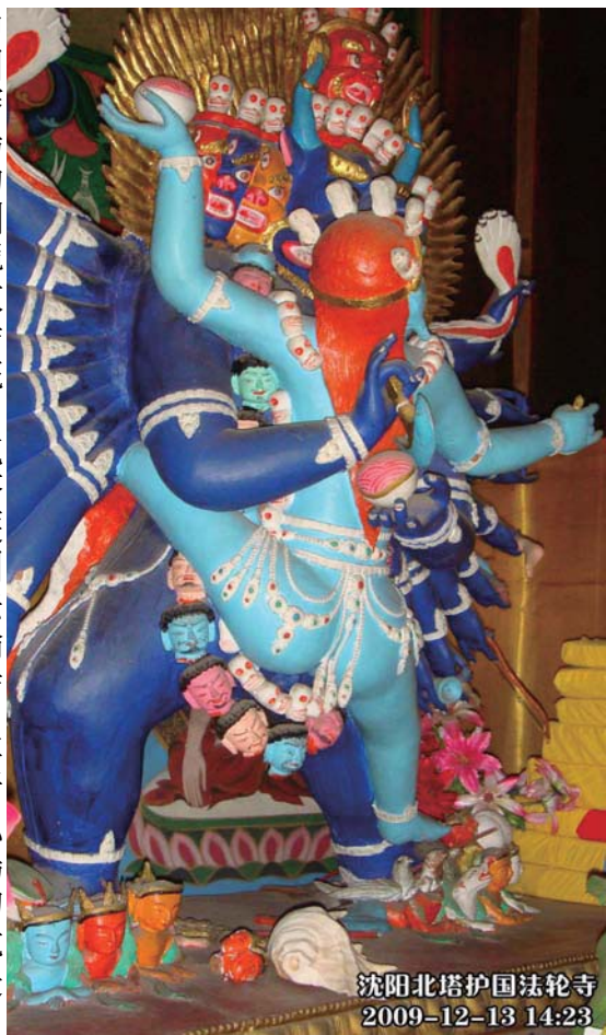
沈阳北塔护国法轮寺 2009-12-13 14:23

中國瀋陽的喇嘛教寺院——北塔護國法輪寺，其所弘揚的就是密宗無上瑜伽男女性交的雙身像。拍攝日期：2009/12/13。