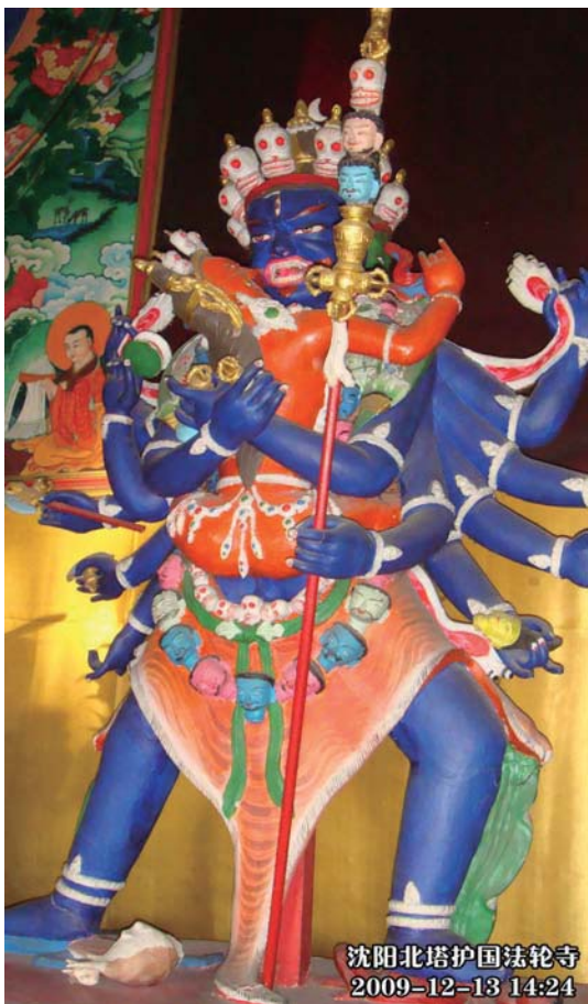
沈阳北塔护国法轮寺 2009-12-13 14:24

不論喇嘛們宣稱的是「無上瑜伽、大樂光明、大手印、大圓滿、樂空雙運」等，都是要與美貌女信徒一一性交的雙身法。